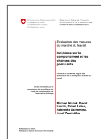
↘ Evaluation des MMT [pdf]

Publiée en mai 2014 en allemand par le SECO, l'étude "Evaluation des mesures du marché du travail – Incidence sur le comportement et les chances des postulants" est désormais disponible en français. Elle analyse les effets des programmes de formation et de type emploi, et indique quelles mesures ont le plus grand impact. De manière générale, on constate que les MMT ont un effet positif sur le succès de la recherche d'emploi. Ainsi, le nombre d'entretiens d'embauche mensuel, tous types de MMT confondus, augmente d'environ 10%. Si chaque MMT contribue à l'effet global, les meilleurs résultats sont obtenus avec la deuxième MMT (+ 16%). Les programmes de base et autres cours orientés sur la personnalité engendrent une forte augmentation du nombre d'entretiens d'embauche mensuels, respectivement de 12 % et de 15 %.