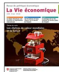
↘ La Vie économique

Considéré comme un succès par ses auteurs, le système de pilotage du service public de l'emploi par les résultats subit quelques modifications au cours de la nouvelle période d'accord (2015 à 2018). Désormais, les possibilités de réinsertion durable des personnes touchant des indemnités de chômage sont évaluées au bout de douze mois au lieu de quatre. Par ailleurs, le pilotage par les résultats s'étendra à la loi sur le service de l'emploi (LSE) dans le cadre d'un projet pilote. Il concernera aussi les demandeurs d'emploi non bénéficiaires d'indemnités, qui ont également droit aux prestations des offices régionaux de placement (ORP). L'un des articles souligne la collaboration nécessaire, dans certains cas et à travers des groupes de travail, entre le service public de l'emploi et l'aide sociale, qui poursuivent un but commun : intégrer autant que possible leurs clients au marché du travail. Certaines voix, en Suisse romande notamment, critiquent pourtant la prise en compte lacunaire des particularités régionales.